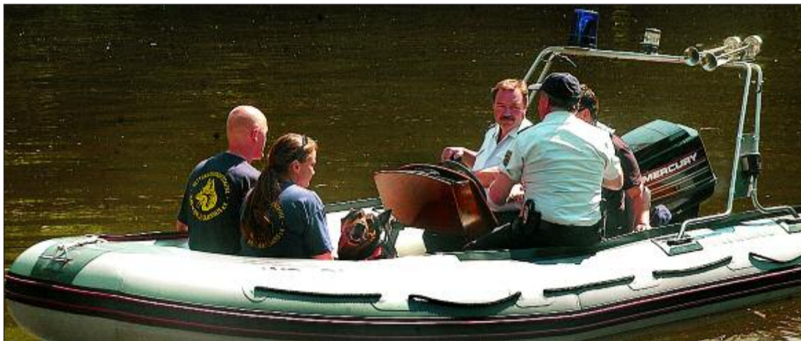
Mit Leichenspürhunden der Deutschen Lebensrettungsgesellschaft suchte die Wasserschutzpolizei gestern auf der Talsperre Kriebstein nach der Leiche des seit Montag vermissten Mannes.

Sechs der Vierbeiner waren gestern ab 10.30 Uhr mit neun Hundeführern und Helfern vom DLRG in Lauenhain im Einsatz. Ihre Aufgabe war es, auf dem Wasser anzuzeigen, wo sie Leichengeruch wahrnahmen. Die Stellen, wo die Hunde sich bemerkbar gemacht hatten, wurden anschließend mit Bojen markiert. An der so markierten, etwa 50 mal 50 Meter großen Fläche rund drei Kilometer flussabwärts vom Talgut Lauenhain, begannen gegen 12.30 Uhr drei Taucher der Bereitschaftspolizei systematisch von außen nach innen mit der Suche in dem trüben Wasser, das nahezu keine Sicht zuließ. Nach zwei Stunden wurden die Taucher abgelöst und neue Sauerstoffflaschen mit an Bord der Boote genommen. Während der Taucher später eine zweite Pause einlegten, meldeten dann gegen 17.25 Uhr Bürger, dass sie einen leblosen Körper in Ufernähe liegend gefunden hätten. Diese Stelle befand sich nur wenige Meter außerhalb der zuvor mit Bojen markierten Fläche.